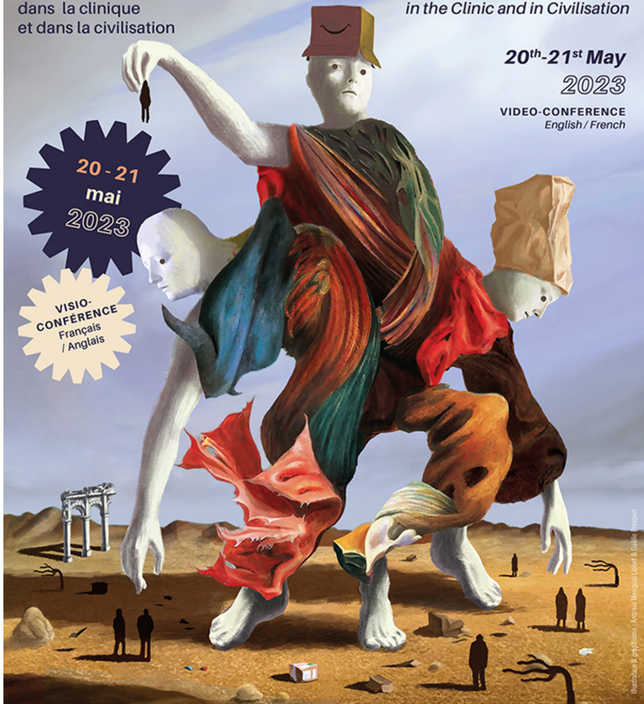
Illustration & graphisme : Artresio Mergulha Libório & Galiléa Protopieri